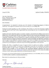
Tout document délivré par une école, un collège ou une université qui contient votre nom et adresse

*Remarque: Votre adresse doit être la même que celle sur votre preuve d'adresse.