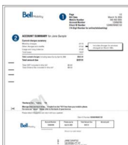
Contrat ou facture pour téléphone cellulaire ou autre prestataire de services publics