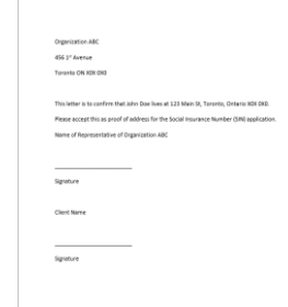
Letter from an organization or institution attesting the applicant's address and signed by a representative of the organization and the applicant

A supporting document may be required if the name indicated on your primary or secondary document is different from the name you are currently using.