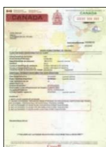
Permis de travail ou d'études délivré par IRCC qui indique « peut accepter un emploi » ou « peut travailler » au Canada.