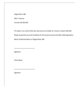
Lettre d'une organisation ou d'une institution attestant de l'adresse du demandeur et signée par un représentant de l'organisation ou institution et le demandeur

Une pièce justificative est nécessaire si le nom figurant sur votre document principal ou secondaire est différent de celui que vous utilisez en ce moment.