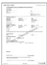
Confirmation de résidence permanente délivrée par IRCC