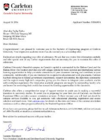
Any letter or document issued by a school, college or university

*Note: Your address must match the address on your proof of address document.