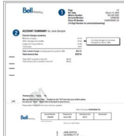
Bill or contract from a cell phone or other service provider