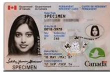
Permanent Resident Card (PR card) issued by IRCC