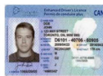
Permis de conduire