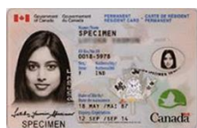
Carte de résident permanent délivrée par IRCC