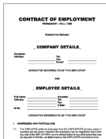
Employment contract with applicant's name and address