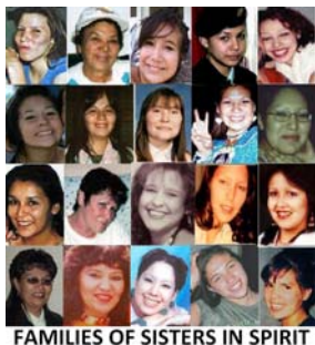
FAMILIES OF SISTERS IN SPIRIT